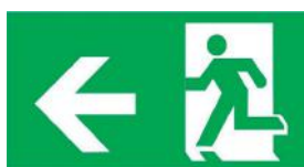
Flèche à gauche