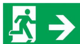
Flèche à droite

1. En raison des conditions spéciales de fabrication, les données représentatives des paramètres optiques ne peuvent que refléter des données statistiques et ne correspondent pas forcément aux paramètres actuels de chaque produit individuel qui pourraient diverger des données représentatives. 2. Le dépassement des tensions et des intensités d'alimentation maximales et provoquera des surcharges dangereuses qui risquent de détruire le luminaire DEL. 3. Consultez les conditions de garantie sur premiseled.com/warranty