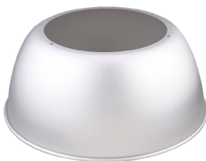
Réflecteur en aluminium