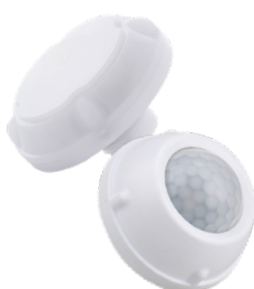
Détecteur de mouvement