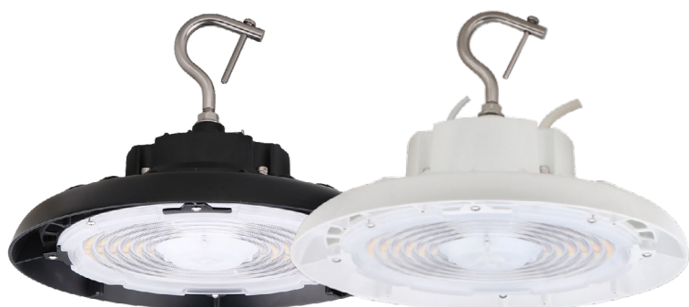
Illustré : modèles 100 W à 150 W Le modèle 100 W est uniquement disponible en noir