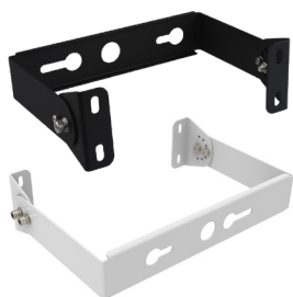
Montage en étrier

Accessoires pour répondre à tous les besoins de votre projet (vendus séparément).