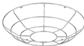
Grille de protection