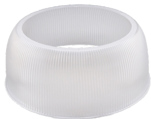
Réflecteur en polycarbonate