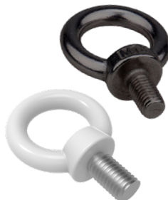
Boulon à œil