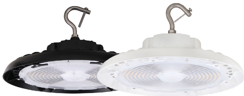
Illustré : modèles 240 W