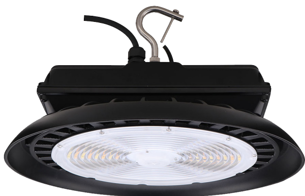
Illustré : modèles 300 W

Tous les modèles sont disponibles en noir (BK)