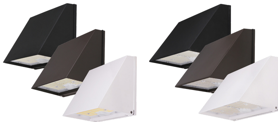
Illustré : modèles 40 W