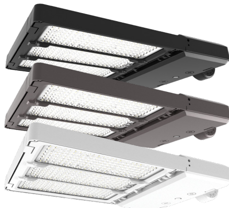
Illustré : modèles 240 W – 300 W

Tous les modèles disponibles en noir (BK) et bronze (BZ)*