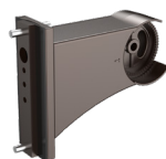
Montage sur poteau