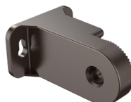
Montage à tourillon