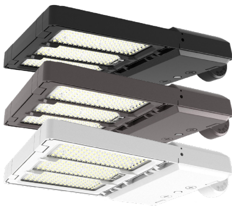
Illustré : modèles 100 W – 150 W