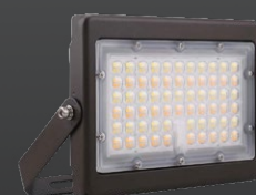
FLM02 80W Éclairage de type mini projecteur