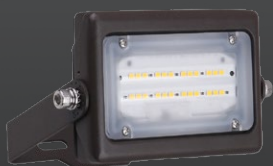
FLM02 15W Éclairage de type mini projecteur