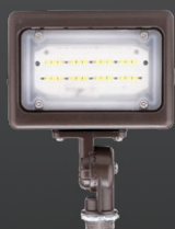
FLM02 15W Éclairage de type mini projecteur