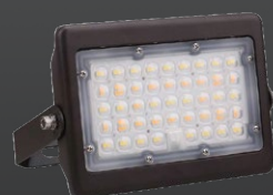
FLM02 50W Éclairage de type mini projecteur